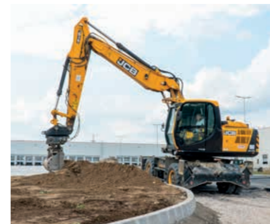
Ipri park közmű- és úthálózat-építésén dolgozik a JCB JS175W gumikerekes kotró.

A fenti pozitívumok, jó hírek mellett beszélgetésünk során sajnos nem kerülhettük el a jelenlegi nehéz gazdasági helyzetet és az abból adódó problémákat sem. A cégtulajdonos elmondása szerint eddig viszonylag jól sikerült átvészelnük a változó körülmények jelentette viharokat, munkaellátottságuk az idei évre megfelelőnek mondható. Ezzel szemben a 2024-es év alakulása még a jövő homályába vész, ám a Mobiltrans vezetősége bízik benne, hogy a folyamatos fejlesztéseknek, a stabil partneri viszonyoknak és a több lábbon állásnak köszönhetően a visszaesés a korábban vártnál csekélyebb lesz majd. További bizakodásra ad okot, hogy lassan de biztosan megkezdődött a generációváltás a vállalkozás életében, hiszen immár a tulajdonosok négy gyermeke is részt vesz a céghez kapcsolódó feladatokban.